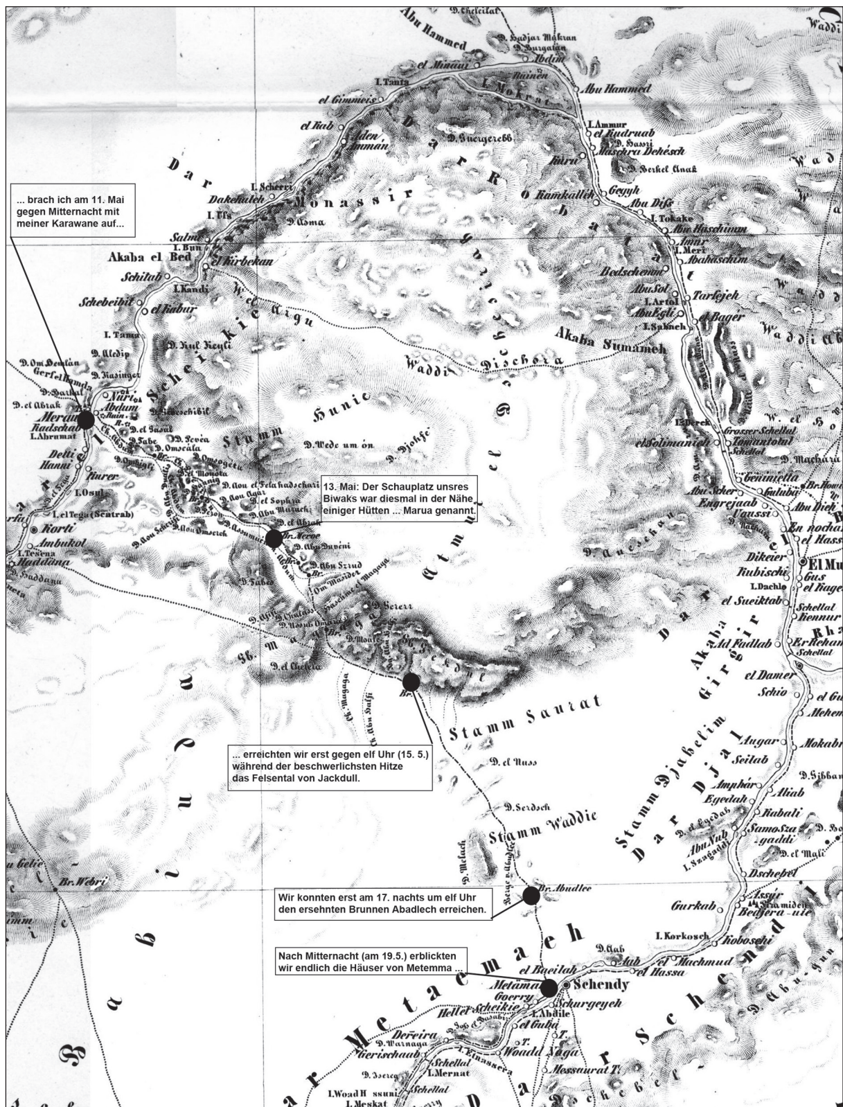
Abb. 2: Reiseroute des Fürsten von Pückler-Muskau (Ausschnitt der Karte von Russegger 1841-49 mit identifizierbaren Haltepunkten von Pückler-Muskau, Gestaltung A. Lohwasser)