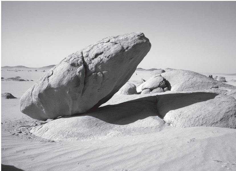
Abb. 4: Die bizarre Landschaft in der Bayuda