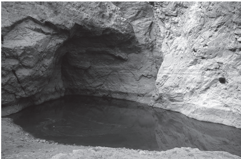
Abb. 5: Die Felsgrotte von Jackdull

Der Reiseverlauf ist durch die Beschreibungen der Natur und einige wenige Ortsbezeichnungen nachvollziehbar. So schildert Pückler „Wir hatten in der vergangenen sternhellen Nacht die Wüste voll schwarzer Granitfelsen und an vielen Stellen Spuren von Vegetation gefunden, was unterirdisches Wasser unter der Oberfläche vermuten ließ.“ 11 Dieses unterirdische Wasser, das auch wir im Wadi Abu Dom vermuten, ist möglicherweise die Voraussetzung für die Nutzung der Region als Lebensraum im 1. Jt. n. Chr. In der mittleren Bayuda beschreibt Pückler „... ein schwarzblauer Felsenkessel ohne die geringste Vegetation. Das aus herrlichem Porphyry und gelblichem Granit bestehende Gestein war in