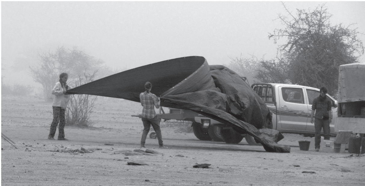
Abb. 3: Zeltabbau bei Sandsturm

Am 11. Mai 1837 brach Pückler mit der Karawane von Merawi auf, um die Bayuda Richtung Shendi zu durchqueren (Abb. 2). 4 Er kam am 18. Mai in Metemme am Nil an, war also eine Woche in der Wüste unterwegs. In seiner Reiseerzählung schildert er Landschaft, Menschen, aber auch täglich ein Abenteuer – wieweit diese ausgeschmückt sind, um die Leserschaft zu fesseln, mag dahin gestellt sein. Interessant ist, dass Pückler sich zunächst in süd-östlicher Richtung bewegte, und daher nicht Kloster und Kirche von Ghazali besuchte: „Zwei Stunden seitwärts unsrer Straße in östlicher Richtung soll sich in Baden-el-Gasali (dem Tale der Gazellen) ein noch ziemlich wohlerhaltener Tempel aus rötlichem Sandstein befinden, nach der Beschreibung aber nur von geringen Dimensionen sein. Ich würde die Mühe nicht gescheut haben, ihn aufzusuchen, da ihn noch kein europäischer Reisender gesehen, der Führer erklärte aber, des Weges nicht recht kundig zu sein, und besorgte, sich zu verirren, weshalb ich die Sache aufgeben mußte.“ 5 Allerdings täuscht sich Pückler, dass noch kein europäischer Reisender diesen „Tempel“ gesehen hätte, denn bereits Hoskins besuchte 1833 das christliche Kloster von Ghazali. 6 Das „Abenteuer“ des ersten Tages bestand in der Begegnung mit zwei Mädchen, eine die „renommierteste Schönheit ihres Dorfes“, die aber – zu seiner Enttäuschung – vor Pückler flohen. 7 Der zweite Tag